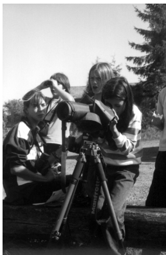
Ça rapproche la longue-vue

Mardi 19, jeudi 21 et vendredi 22 septembre, 7h15 du matin : les hirondelles de fenêtre, hérons cendrés, bergeronnettes grises, busards des roseaux, foulques macroules et canards colvert des implantations scolaires belges sont impatients de prendre le car qui les mènera le temps d'une journée dans le Parc Naturel Régional de Lorraine.