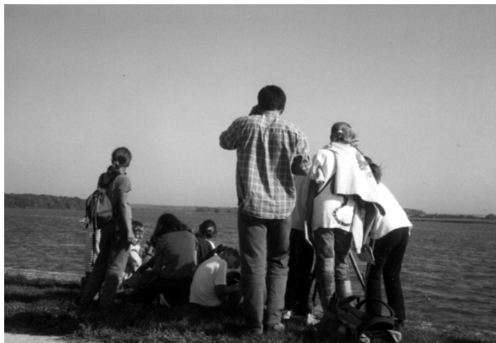
Sur les berges de l'étang de Lindre

Évasion gourmande, hommage aux richesses et au savoir-faire de notre terroir, le marché gourmand et artisanal d'Attert est sans aucun doute le rendez-vous où il fait bon renouer avec ses racines !