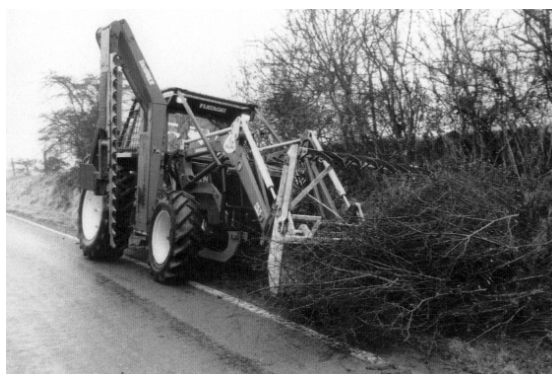
L'équipement idéal : tracteur équipé d'un taille haie et d'un chargeur frontal

Une convention entre la commune d'Attart et l'Atelier Environnement Tohogne devrait permettre à l'avenir d'envisager une formule simple et efficace en matière de taille de haie : cette association propose en effet la taille de haies (toutes essences, toutes dimensions) chez les agriculteurs, particuliers, associations,... avec le matériel et l'opérateur adéquats, à un prix très démocratique (actuellement fixé à 500 F/heure). La commune signataire contribue également au financement à raison de 750 F/heure prestée sur son territoire. Ce système, en place ou en projet dans 21 communes a devant lui un bel avenir !