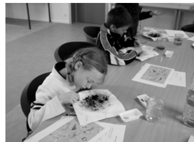
Si les activités requièrent de la concentration ...

12/11 : atelier au Festival des Sciences à Luxembourg.