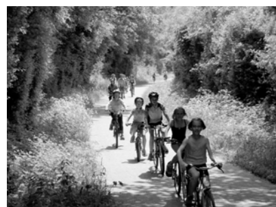
... elles permettent également de se défouler

Les activités se déroulent, sauf indications contraires, le mercredi de 14h à 16h30.