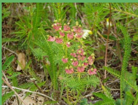
Euphorbe petit-cyprès de la carrière de Tattert