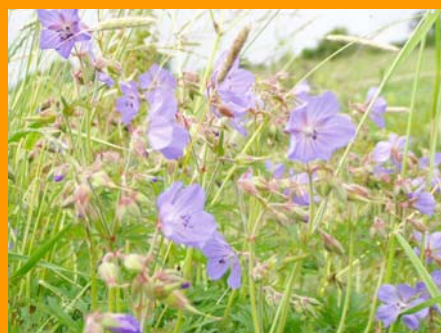
Géranium des prés