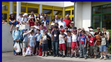
Les « Pappalapiens » lors de leur semaine au Grand-Duché