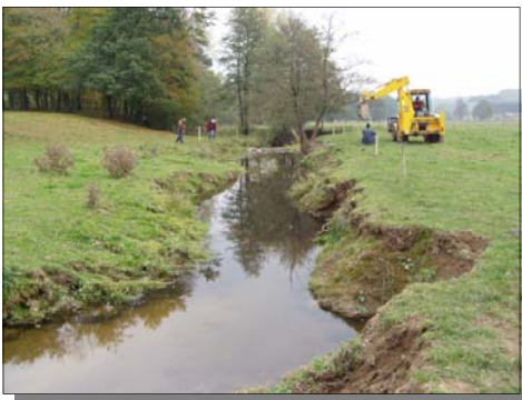
Etat de la berge en septembre 2003

Un suivi de l'aménagement réalisé en septembre 2003 sur le ruisseau de la Nothomb lors de l'étude précédente a également eu lieu. Pour rappel, cette étude était intitulée « Évaluation physico-chimique et biologique du bassin versant de la Haute Attert belge et aménagement en vue de restaurer l'habitat de populations piscicoles » et comportait un volet d'aménagement de berge par technique végétale (pose de peignes, recepage d'une partie de la ripisylve, plantation de saules et d'aulnes sur la berge, pose d'une clôture pour limiter l'accès du bétail à l'eau en un seul point, ...). Lors de la visite de contrôle en 2004, nous avons pu constater que les plantations ont bien repris et vont, à l'aide de leurs racines, protéger la berge de l'érosion, que les arbres recepés rejettent et que les peignes posés ont rempli leur rôle et ont permis la reconstitution de la berge. Des petits aménagements doivent être poursuivis : pose d'un peigne sur un nouvel effondrement, poursuite des plantations sur les pieds de berges reformés, recepage par rotation de la ripisylve dans les années à venir. Dans l'ensemble, ces aménagements ont permis une très bonne remise en état de la berge comme vous pouvez le constater sur les photos ci-dessous.