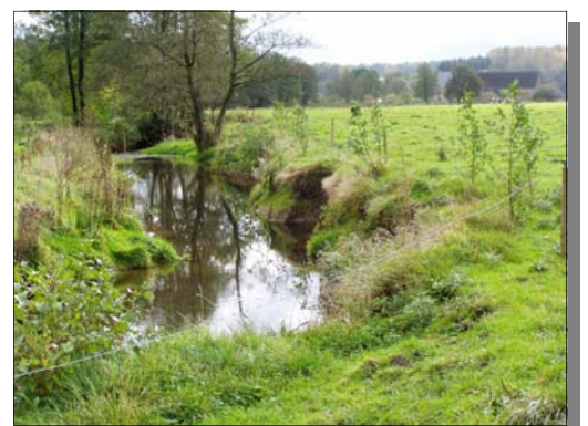
Etat de la berge en septembre 2004