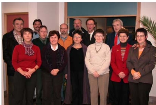
Quelques membres de la Commission de Gestion