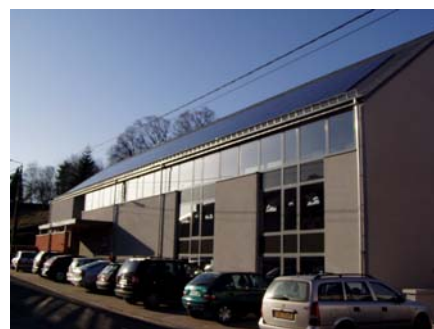
Installation photovoltaïque de l'école d'Attert

La fiscalité, qui incite de plus en plus à adopter des comportements « verts », augmente l'attrait du photovoltaïque. Ainsi par rapport à 2008, il faut compter 3 ans de moins pour amortir une installation photovoltaïque, soit 4 ans. Le tableau ci-dessous montre l'évolution du coût d'une installation et son impact sur la durée de l'amortissement.