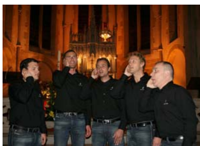
Voce Isulane Bettborn - 4 septembre