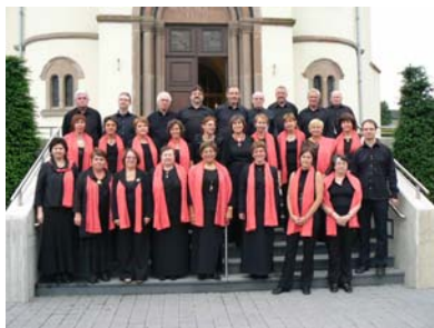
A Travers Chants Attert - 29 août