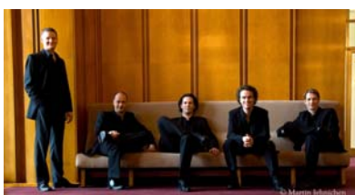
Amarcord Beckerich - 19 septembre