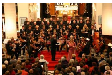
Vocaal Collectief Tontelange - 3 octobre