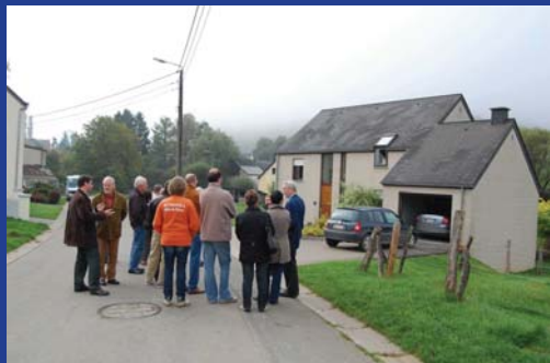
Visite RGBSR organisée en octobre

Inscription, réservation ou complément d'information ? 063/22 78 55