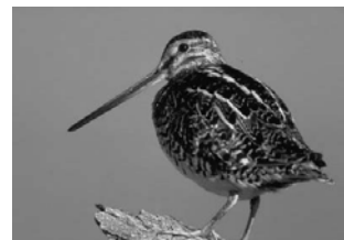
Bécassine des marais

Natura 2000 est la garantie d'une vision à long terme de la protection de la nature.