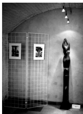
Fête du Parc Naturel 2002 à Attert

Une bonne fête demandant une bonne préparation, les mouvements associatifs de Metzert pensent déjà à l'organisation de l'édition 2004 et ce ne sont pas les idées qui manquent. En partenariat avec l'asbl "Au Pays de l'Attert", le Patro Desmond Tutu et le Cercle Saints Côme et Damien ont décidé d'axer cette 12 ème fête du Parc Naturel sur les quatre éléments : air, eau, terre et feu .