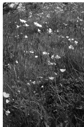
Prairie humide à cardamines et renoncules

Enfin, la pollution par les nitrates, phosphates, pesticides, substances chimiques et métaux lourds en excès, d'origine agricole, industrielle ou domestique, est toxique ponctuellement. Mais, plus diffuse, elle peut également enrichir les terrains à l'excès (eutrophisation), s'en suit une perte de la diversité biologique par la disparition des espèces les plus sensibles et l'envahissement des milieux par des espèces souvent banales et parfois introduites.