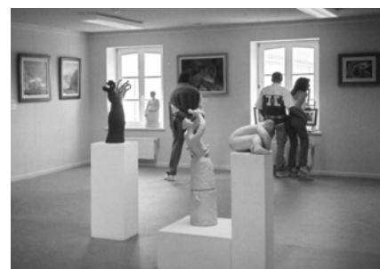
Fête du Parc Naturel 2002 à Attert

Dans ce cadre, nous proposons aux artistes peintres, sculpteurs, photographes, ... de la Vallée de l'Attert belgo-luxembourgeoise de travailler dès à présent ce thème et de participer à l'exposition qui aura lieu le dimanche 02 mai 2004 dans les granges et autres lieux de Metzert. Tout autre type d'art est également envisageable : landart, jardins éphémères, ... La nature, comme moyen d'expression peut donner lieu à des créations surprenantes. Ces mêmes artistes sont également invités à proposer des animations pour enfants et/ou adultes.