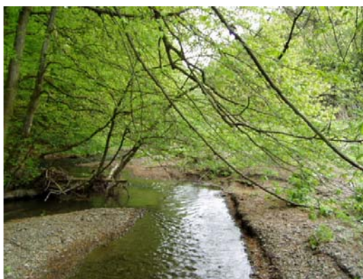
La rivière, un milieu à surveiller

Ces petits animaux ont un rôle écologique essentiel. Ils dégradent les éléments morts comme les feuilles par exemple, ils constituent une part importante de la nourriture des poissons et enfin, certains, par leur sensibilité aux polluants, permettent d'évaluer de manière précise la qualité des rivières.