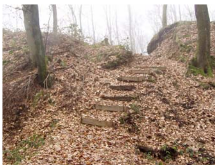
Chemin d'accès au Burgknapp

Les 10 et 11 septembre prochains auront lieu en Wallonie les Journées du Patrimoine. Le thème de cette année est : « Regards sur le Moyen Âge ». C'est donc l'occasion de présenter le site archéologique du « Burgknapp » à Heinstert.