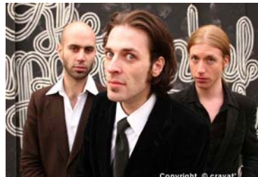
Experimental Tropic Blues Band

Un cd six titres est également sorti au mois de janvier, « Dynamique Boogie ».